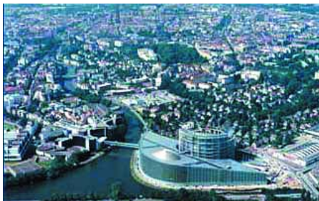
Parlamentul European (Strasbourg). Vedere generală

(Verts/ALE) cu 42 membri; - Grupul confederal al stângii unite Europene/Stânga Verde Nordica (GUE/NGL) cu 41 membri; - Grupul pentru Democrație și Independență (IND/DEM) cu 36 membri; - Grupul Uniunii pentru Europa Națiunilor (UEN) cu 27 membri; - Grupul celor neînscrisi (NI) cu 30 membri. Parlamentul European mai numeste și un